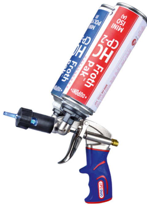
Dosiergerät CP2 DUO mit montierter Mischdüse

Die Mischdüse kann für verschiedene Anwendungszwecke eingesetzt werden. Im Flächenspritzverfahren können Laibungen, Wände, Decken, Rollladenkästen uvm. gedämmt werden. Durch das Aufstecken der Düsenverlängerung (Kunststoffrohr) ist die Mischdüse als Montagedüse zum Füllen von Fugen, Hohlräumen, für schmale, enge oder auch schwer zugängliche Stellen zu nutzen!